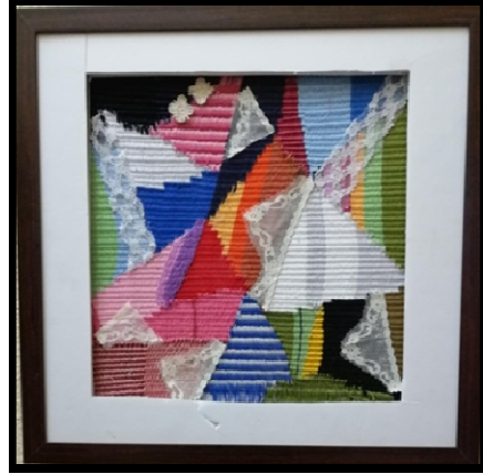
مشغولة (٢)، (٣)